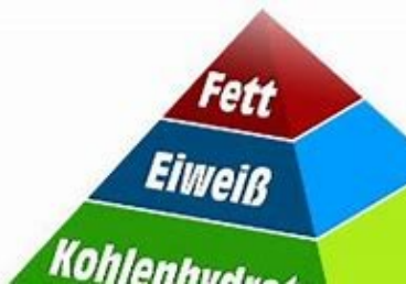
Baustoffe und Brennstoffe